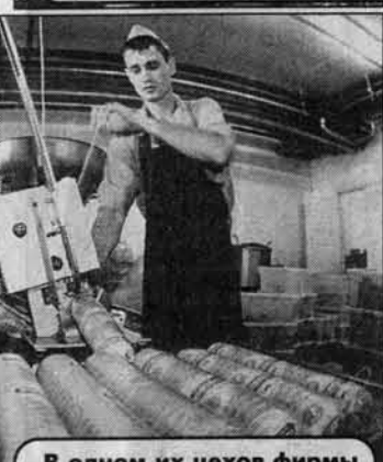
В одном из цехов фирмы "Брюкке".