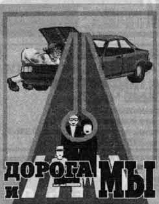
ДОРОГА И МЫ