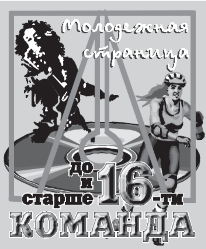
Наш адрес в Интернет: http://www.ap.altregion.ru/komanda/ .