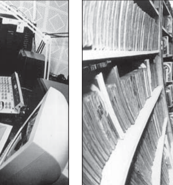
Здесь хранится голос.