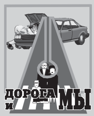
Дорога и мы

ЖИЗНЬ ТЕЧЕТ, ВСЕ ДОРОЖАЕТ. Вот и руководство АвтоВАЗа решило поднять цены на свою продукцию.