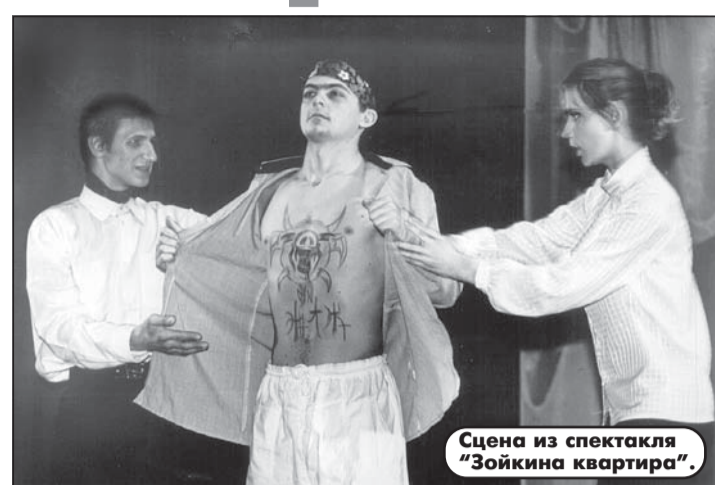
Сцена из спектакля “Зойкина квартира”.

И что вы думаете? Мы увидели увлекательное театральное действо, настолько оно было