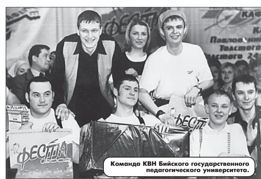
Команда КВН Бийского государственного педагогического университета.