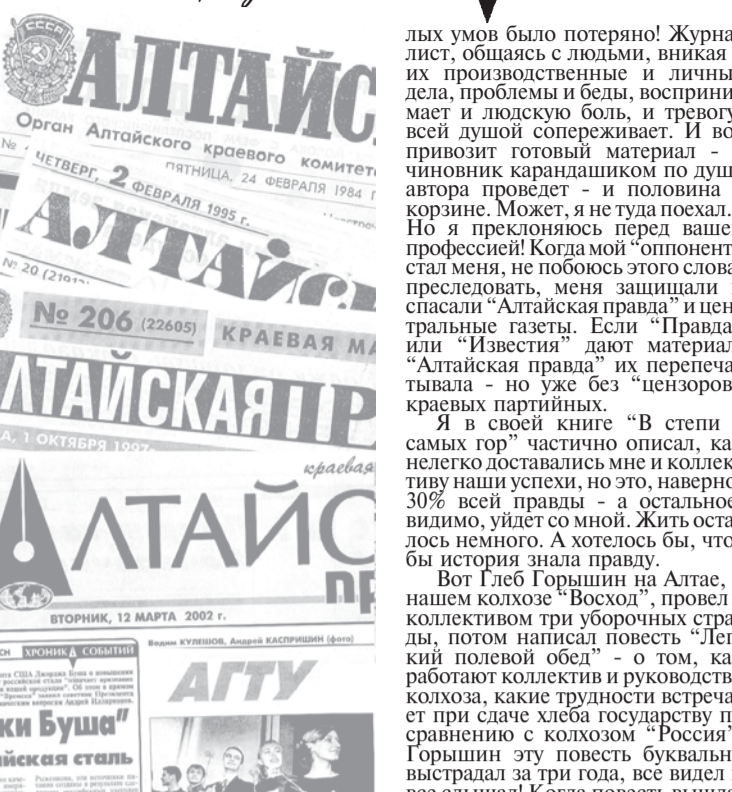
"Ножки Буша" и российская сталь

Обработать 30 лет в колхозе, из них 24 года председателем, и 20 лет иметь "оппонента" красной маяк - колхоз "Россия" - у нас с ним общая граница полей тянется до десятка километров - это было неспросто.