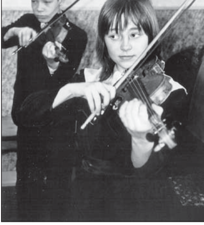
Музей истории Барнаула.

Пока он занимает два небольших зала, в которых размещены фотографии, старинные книги и предметы быта прошлых лет, полученные в основном в подарок от организаций города и частных лиц. Идея создания такого музея принадлежит администрации Барнаула. 10 ноября 2000 года было издано постановление, в котором говорится, что муниципальный музей создается в целях увековечения исторических традиций города, сохранения преемственности поко-