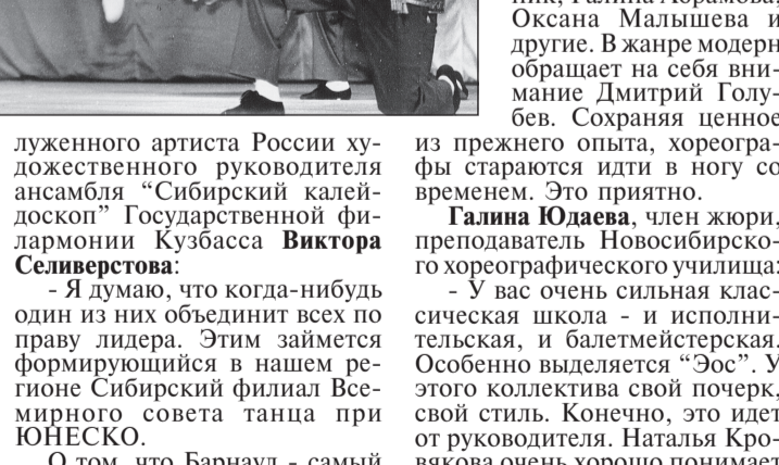
Участники конкурса "БИС-2002"