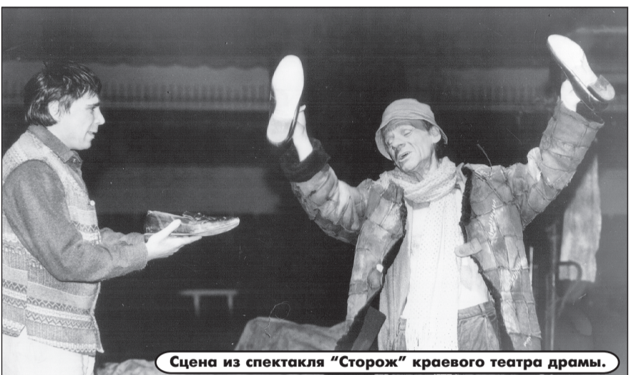
Сцена из спектакля "Сторож" краевого театра драмы.