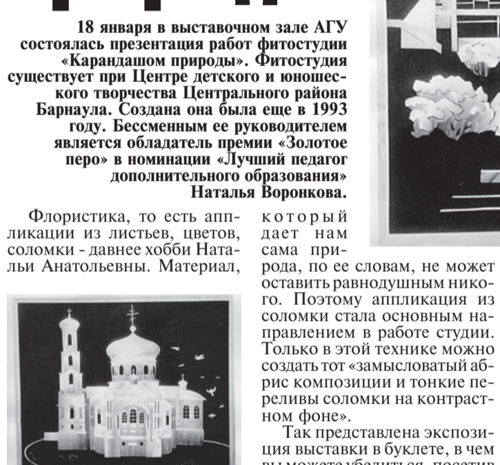
Выставка в Фитогруппе «Карандашом природы»