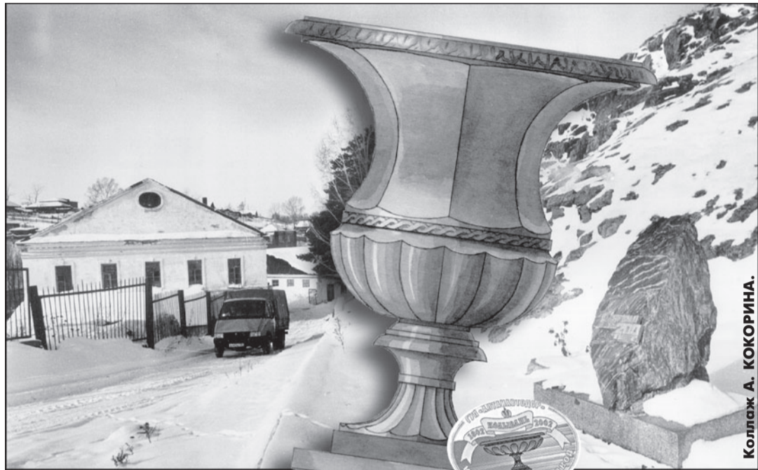
Колывань А. КОКОРИНА

Разговор с губернатором приобщил уверенность, что поднимется Колывань, окрепнет и заявит о себе новыми изделиями из алтайского камня, место которым в лучших музеях мира.