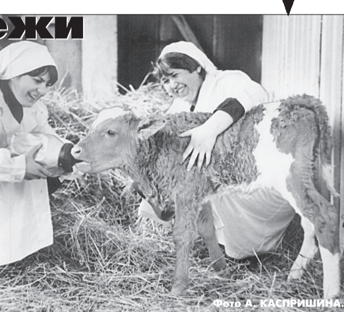
«Крестьянские заботы» собрали А.АСТАПОВ, Н.ГУРТЕНКО, Ю.САВЕЛЬЕВ.