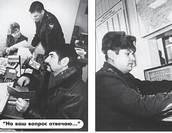
Дежурный всегда на посту.

сложную жилищную проблему обострит готовящееся сокращение численности Вооруженных сил. Эти заботы лягут на плечи сотрудников 3-го отдела. 4-й отдел проводит набор на службу по контракту. В прошлом году призвано более 1000 человек, свыше 300 из них - на Северный Кавказ, более 60 - в Таджикистан, в 201-ю мотострелковую дивизию. Попасть туда сложно, отбор ведут представители дивизии, и он очень жесткий. Последняя отправка была в начале декабря - из 50 добровольцев взяли только 22. В 4-м отделе работают с льготниками. Здесь же разбираются всевозможные жалобы, ведется