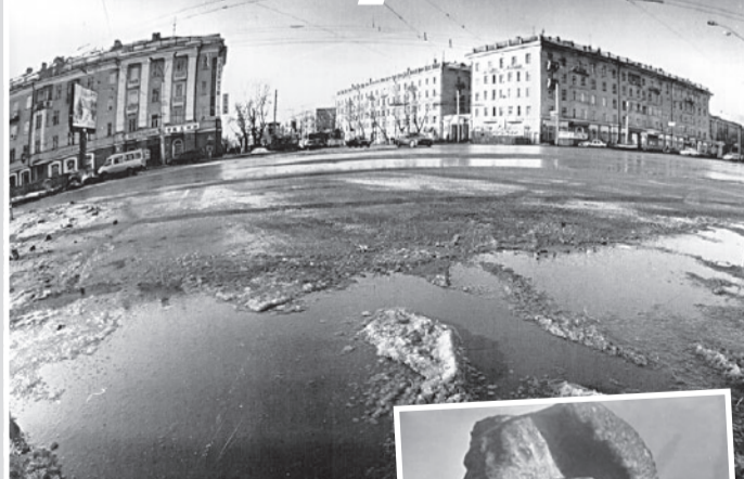
На площади Октября мокро.

Радио ежедневно передает сводку погоды: «Днем в краевом центре одиннадцати градусов выше нуля».