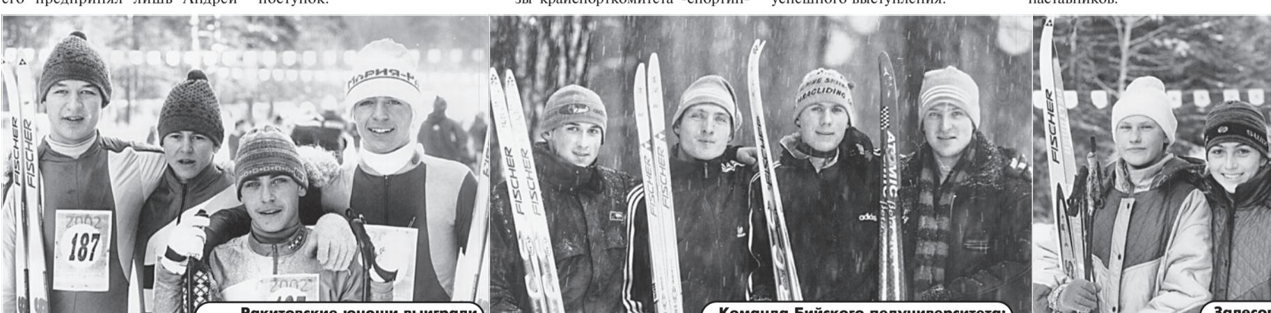
Залесовские красавицы не оставили конкуренткам ни единого шанса.