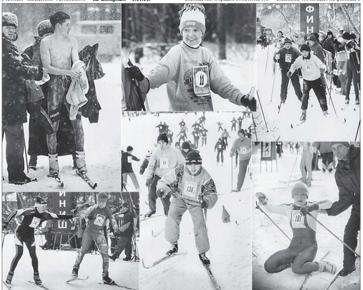
Ракитовские юноши выиграли соревнования среди школьников.