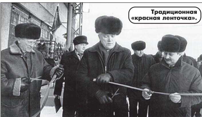
Традиционная «красная ленточка».