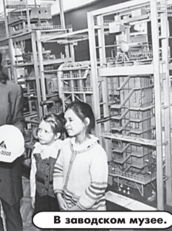
В заводском музее.