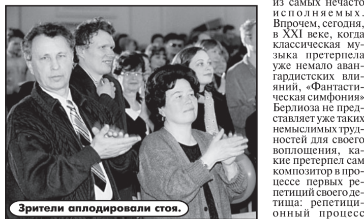
Зрители аплодировали стоя.