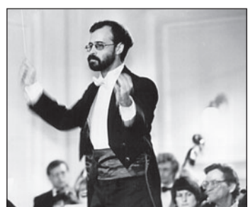
Что, понятное дело, требовало от музыкантов особых навыков и терпения.

Однако, невзирая на свою «студенческую» сущность, это поистине грандиозное произведение стало, с одной стороны, одним из самых программных сочинений композитора; а с другой (в силу трудности исполнения) - одним из самых нечасто исполняемых. Впрочем, сегодня, в XXI веке, когда классическая музыка претерпела авантагардистские влияния, «Фантастическая симфония» Берлиоза не представляет уже таких немалых трудностей для своего воплощения, какие претерпел сам композитор в процессе первых репетиций своего великого репетиционного процесса в Берлиозе - тогда сравнил «с переходом армии Наполеона через Березину», но и опубликовал литературный текст ее программы (собственного, заметим, сочинения) в газете «Фигаро» и это был первый подобный случай в истории симфонического жанра.