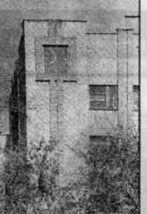
«Часы пол краше», 18 октября. Здание «Алтайкоммунапроекта» по проспекту Ленина в Сибирском, 43.