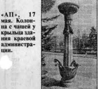
«Ап», 17 мая. Колонна с часовней в крыльце здания краевой администрации.