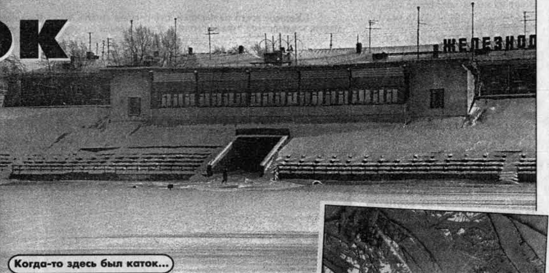
Когда-то здесь был каток...

И у меня перед глазами каток, залитый огнями прожекторов, и множество людей, одетых не по-сегодняшнему. И эта мелодия, уже тогда, столько лет назад, зазвнявшая всем нам старинной. Это я о времени, когда катаньем на коньках были увлечены повально все: школьники, учителя, родители. Иногда на каток набивалось столько народа, что невозможно было побегать, и публика «вжикала» коньками по кругу. Непременное находилось озорники, умудряющиеся носиться в этом, будучи в строю (р-раз - левой, два - правой), скользким маршем, сбивая его ритм на своих коньках, прикрученных веревками к валенкам. А еще были конь-