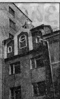
«Между прошлым и будущим», 29 сентября. Часовня в переходе между старым и новым корпусами железнодорожной больницы.