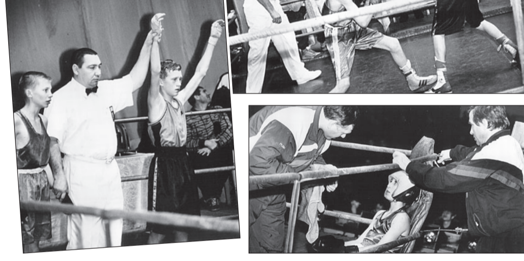
Соревнования проходили в двух возрастных группах. Мальчишки 1986-87 годов рождения выступили в рамках турнира краевого спортивного общества профсоюз «Россия», а ребята постарше - 1984-85 годов рождения - разыграли награды первенства края среди юниоров.