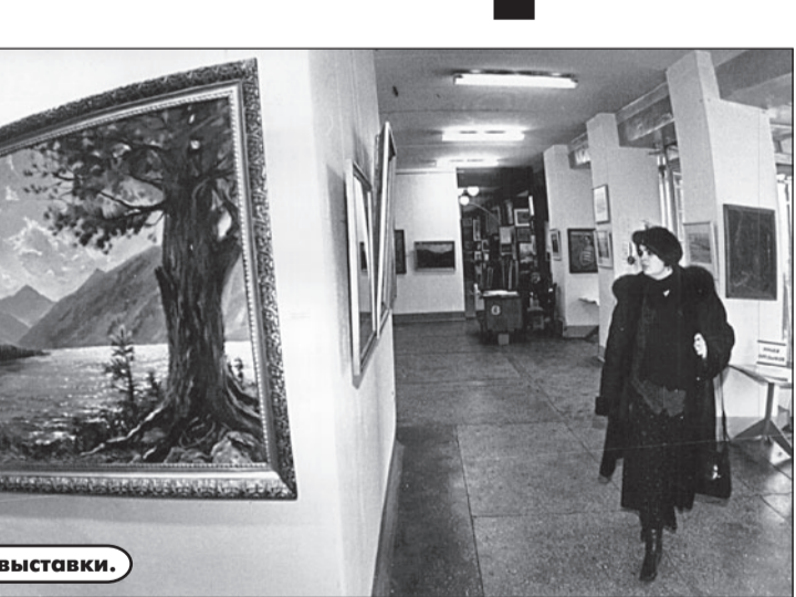
В залах выставки.