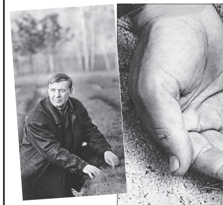
(Начало на 1 стр.)