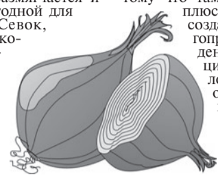
Выламывание стрелок, как показала практика, не дает положительного результата - луковицы не хранятся, такой лук можно использовать во время роста только на зеленое перо.

Легкоспосебным оказался лук сорта Бессоновский, выращенный одностебельной культурой, некрупные луковицы диаметром 3,5-4 см хорошо хранятся. Как и нестрелкующийся лук, так называемый «семянка». Правда, луковица его небольшого размера. Для того чтобы они были крупнее, во время выращивания его прореживают, оставляя в гнезде 3-4 штуки. «Семянку» мы храним в подвале пятиэтажного дома. Кстати, в последние годы полностью обеспечиваем себя речными луком.