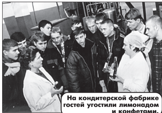
На кондитерской фабрике гостей угостили лимонадом и конфетами.