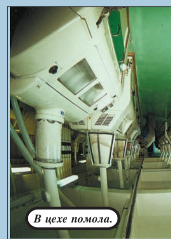
В цехе помола.

Р.С. 26 октября на Красноярской выставке завоевал медаль подсолнечное масло "Мельника".