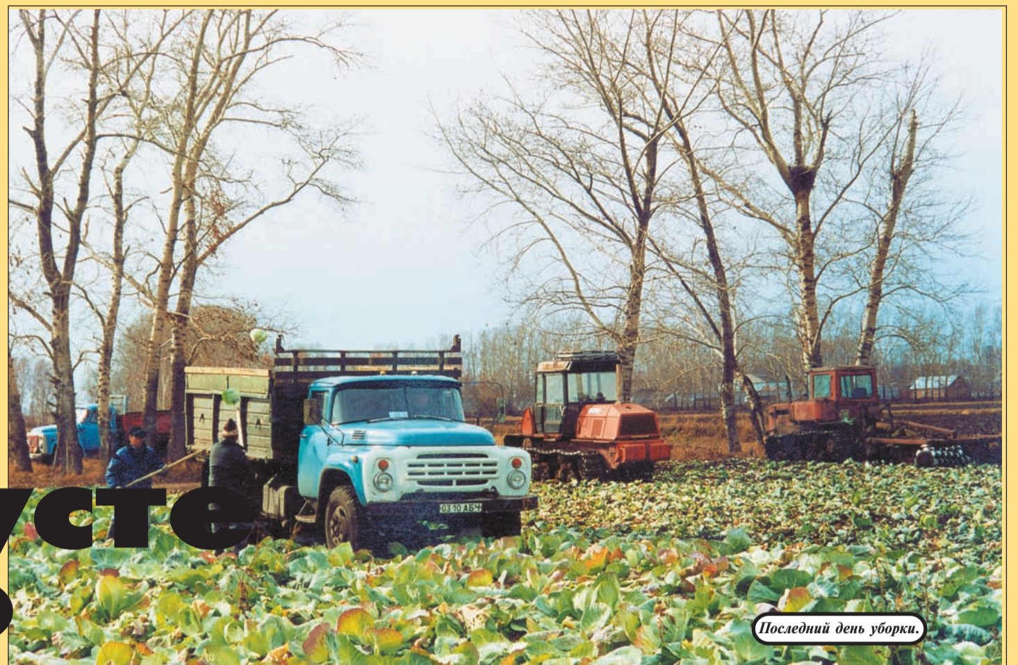
Последний день уборки.