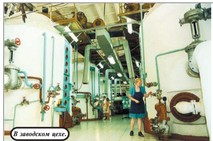
В заводском цехе.

тывает половину выращиваемой на Алтае свеклы. Политика простая и ясная: создать поставщикам сырья благоприятные условия. Не первый год завод сам закупает высококачественные семена и обеспечивает ими все хозяйства, причем на льготных условиях. То же самое касается и тербишцов. Закупили 25 автозаборных машин, несколько свеклоборочных комплексов и в виде кредитов распределили эту технику по хозяйствам.