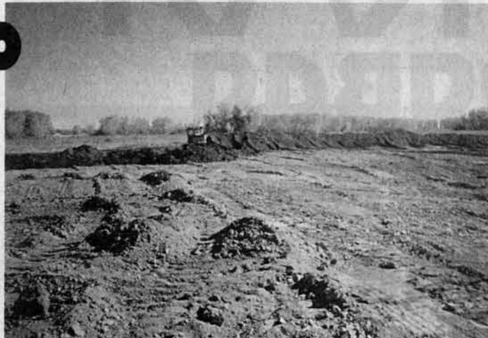
После подрыва ракет на территории в Алейском районе начались работы по рекультивации почвы.