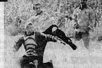
ТРЕТЬЯ ЛИГА: 37. Пруды, 38. Малаховское кольцо, 39. Телефонная, 40. Солнечная поляна-2, 41. Атланта, 42. ВРЗ-2, 43. Сулима-2, 44. Новые корабли, 45. Малаховские часы, 46. Балтийская-2, 47. Эдельвейс, 48. Поспелиха.