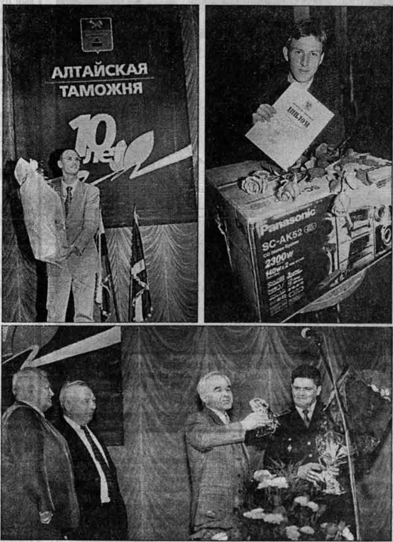
В.МИХАЙЛОВСКИЙ, Е.НАЛИМОВ (фото)