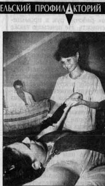
На снимках: на процедуре грязелечения; занятия на тренажерах под наблюдением медперсонала.