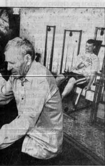
На снимках: на процедуре грязелечения; занятия на тренажерах под наблюдением медперсонала.

для жилья, для тепла... И берегли его тогда как зеницу ока. Почему же сейчас превращают лес в помойку?