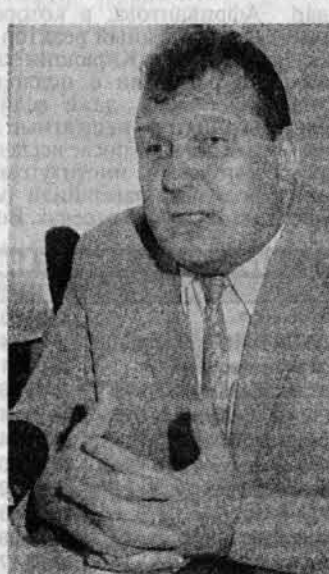
сине до 8-10 тысяч рублей. Разработаны программы кредитования жилья и платного образования для детей котельщиков. Уже отремонтирован фасад заводоуправления, доведен до ума этаж конструкторов.

На котельном начнется постепенное увольнение пенсионеров. Сейчас из 2,5 тысяч