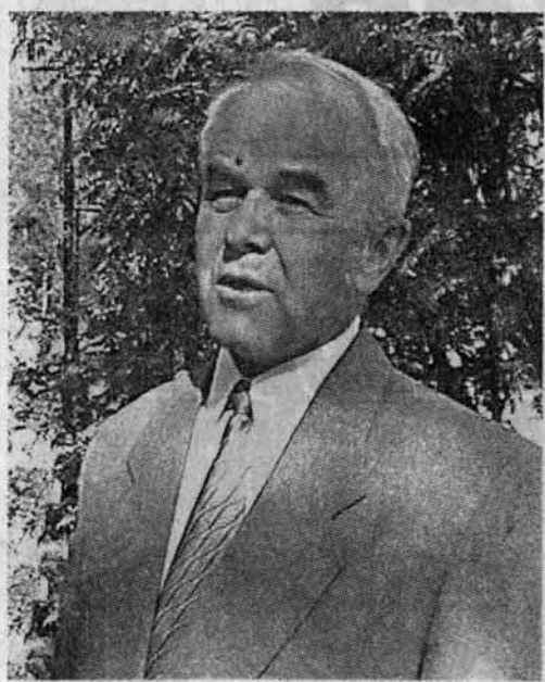
Легко работать с ним и сегодня. Воспринимая к новому, думает о будущем завода. И по-прежнему старается избежать конфликтов: пытается понять человека, прийти, как сейчас модно говорить, к консенсусу.

В 1966 году на практике я пришел на работу в цех N 6.