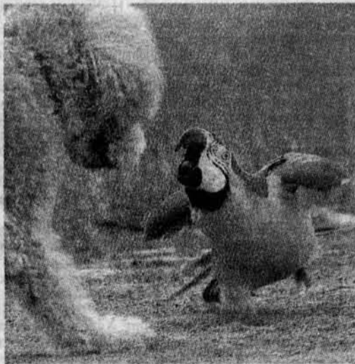
Когда-то хозяйка спасла Горди, так зовут этого попугая, от зубов ротвейлера. Теперь же птичка не упускает шанса отыграться на собачках поменьше.

Будучи по профессии крутильщиком сигар, он недолго мучился над вопросом, чем бы удивить весь мир, и сделал то, что выходит у него лучше всего, - сигару.