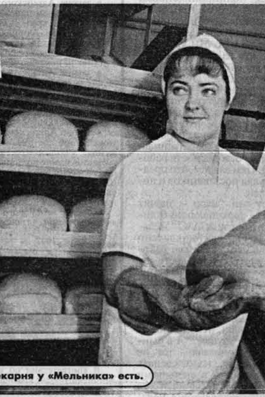
И своя пекарня у «Мельника» есть.

Сейчас любой клиент, только ступив в фойе заводоуправления «Мельника», первым делом сталкивается со стендом во всю стену, где исторические фотографии и скульптурные фотографии и скульптурные фотопродносит ему наиболее значимые вехи предприятия. Не хочется - да оставишь. Знаете, например, кто участвовал в монтаже и вел технический надзор за строительством мельзавода? Приехавший из Новосибирского отделения «Союзмуки» Юрий Кондратюк, теперь признанный в мире одним из осново-