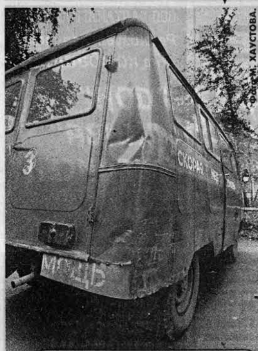
«Такие скорости не для «скорой»»