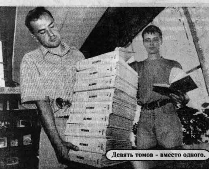
Девять томов - вместо одного.