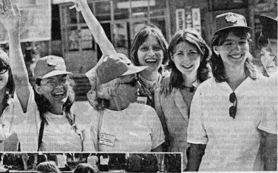
У юных барнаульцев в течение последних двух-трех лет уже вошли в привычку полудневные бдения с пивом, танцами и другими народными забавами, обычно развертывающиеся на этой площади города в последнее воскресенье июня, когда традиционно отмечается День молодежи.

И все же, все же... Хотя на лотках у продавцов и не было видно бутылки с пивом (ну, лично я не приметила), любители этого напитка встречались то там, то здесь (кто-то, по всей видимости, употреблял и кое-что покрепче). Не прошло и полутора часов с начала праздника, как на асфальте засверкали осколки разбитых бутылок, упали под ноги окурки. Да, видимо, еще далеко не вся молодежь города готова бороться за здоровый образ жизни.