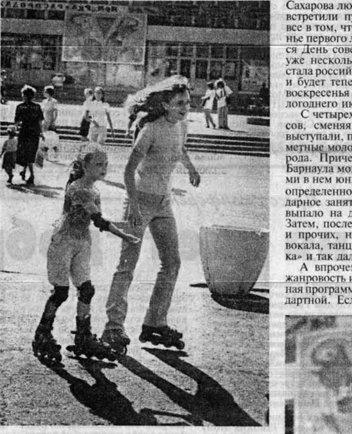
В этот день в Барнауле отметили День российской молодежи.

В среду на площади Сахарова проходило многочасовое действо, посвященное Дню российской молодежи.