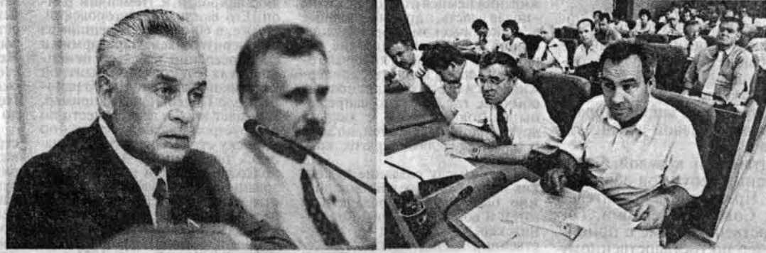
28 июня в Барнауле состоялась пятнадцатая сессия краевого Совета народных депутатов.

Принят закон о программе содействия занятости населения Алтайского края на 2001-2002 годы. Основным разработчиком программы является Департамент федеральной государственной службы занятости населения по Алтайскому краю. В разработке также приняли участие 10 управлений и комитетов краевой администрации, крайсовпроф, органы местного самоуправления. (Омоужение на 2 стр.)