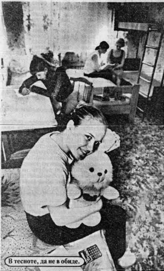
В тесноте, да не в обиде.