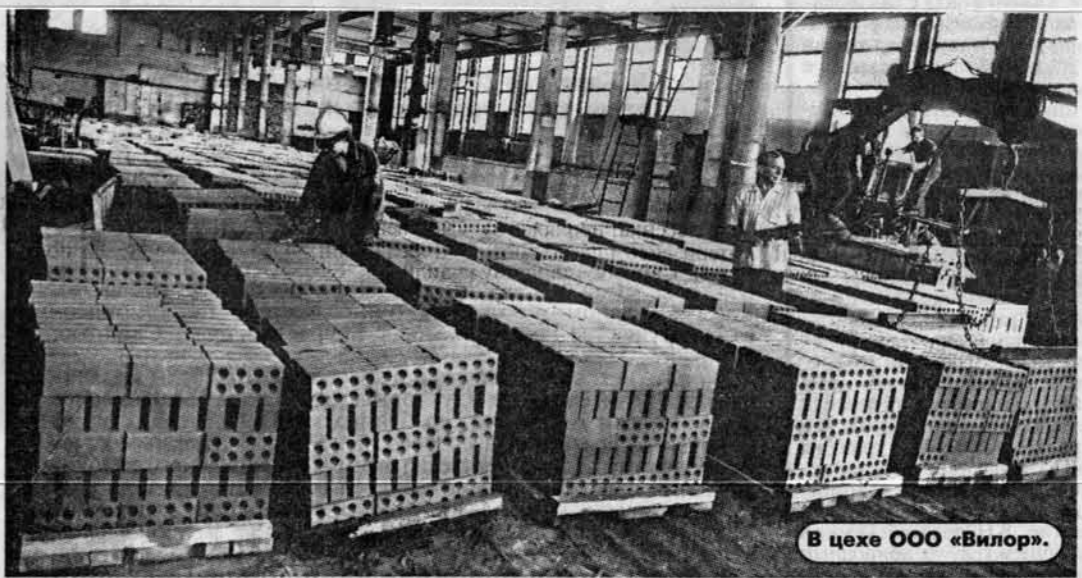
В цехе ООО «Вилор».