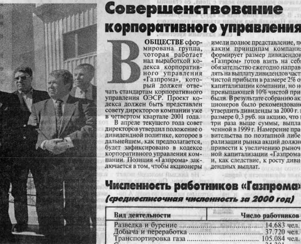
20 мая началась промышленная эксплуатация Мыльджинского газоконденсатного месторождения (Томская область).