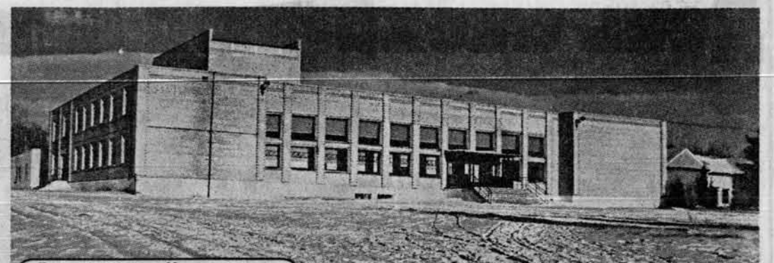
Дом культуры в Новошпунное.