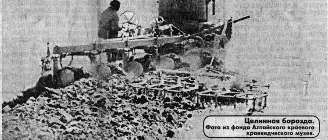
Целинная борозда.