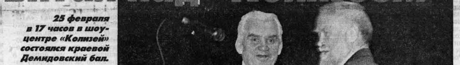
25 февраля в 17 часов в шоу-центре «Коллизеум» состоялся краевой Демидовский бал.