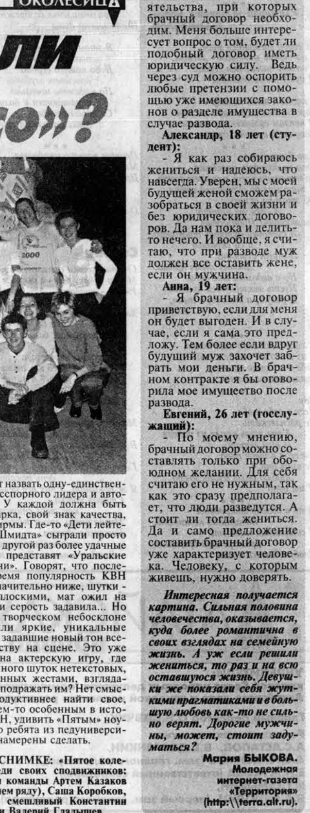
Команда КВН «Пятое колесо» пединверситета Барнаула

НАЧИНАЛОСЬ все лирично и приторно: с сыркового лагера. Несколько ребят из нынешних КВНщиков работали в лингвистическом лагере, который организовала краевая автономия российских немцев. Там родилась команда «Пятое колесо». Как-то само собой приставилось «пятое». У «колесников» (в вузе их называют только так) принято прислушиваться к каждому мнению. И если в чей-то голове мелькнула блестящая мысль, ребята придают ей нужную форму и объем и выпускают в люди. Примерно такое: «В городе Б. было открыто новое хирургическое отделение. Право первым разрешить пациенту предоставить мэру города». Самые первые, важные и самые любимые зрители - родители, жены, дети и другие лица, приближенные к артистам. Ребята признаются, что мечтают о малом: когда они станут Великой командой российского масштаба, собрать своих близких в определенной дозе, чтобы мамы-папы, переглядываясь с вальжастором: «О, это мой оболтус!». Кстати, когда-то эта группа называлась шоу-театром. Из шоу, по их словам, они уже выросли и теперь занимаются принципиально другими делами. КВН обязывает к большому, предельно интеллигентному, состязанию в смекалке и сообразительности, сложной пилотаж, требующий постоянного самосовершенствования. «Колеса» созили, возмужали и поняли наконец, зачем на микрофон сетку надевают: «Да все просто - «базар фильтровать». Из известных КВНовских команд, блистающих в высшей лиге, «колесники» из пединверситета