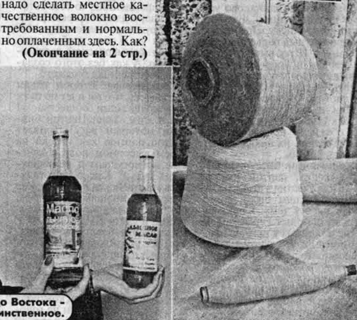
От Урала до Востока - единственное.