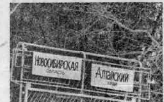
Какая боль, какая боль!

Знающие люди говорят, что ей памятник надо ставить за такой результат - нездало до соревнований Лена перебежала восточнее ледника.