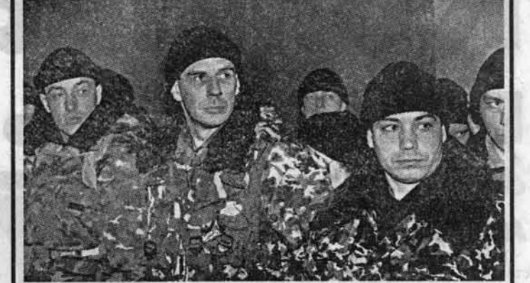
Поздно вечером в минувшую среду с железнодорожного вокзала Барнаула ушел эшелон в Чечню.

Мы уже не раз сообщали о том, что свыше 300 сотрудников милиции в течение трех месяцев будут нести службу во временном отделе внутренних дел УВД Алтайского края в городе Шали Чеченской республики. Затем их сменят другие - график пребывания в «горячей точке» алтайских милиционеров расписан на год.