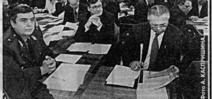
В нынешнем году посевная площадь в крае составит 5,3 миллиона гектаров. Зерновые и зернобобовые культуры займут 3,5, кормовые - 1,5 млн. га. При этом финансово-экономическая ситуация по-прежнему остается весьма сложной.