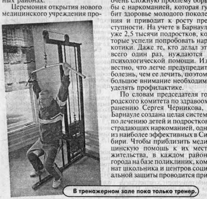
В тренажерном зале пока только тренер.

Он разместился в здании бывшего дельтас N 120 «Сибэнергомаша» по улице Советской в городе. Это второй и самый крупный подобный центр в городе, занимающий два этажа площадью 200 квадратных метров. Первый работает в Индустриальном районе, на очереди открытие центра в Октябрьском, а затем и в остальных районах. Церемония открытия нового медицинского учреждения про-