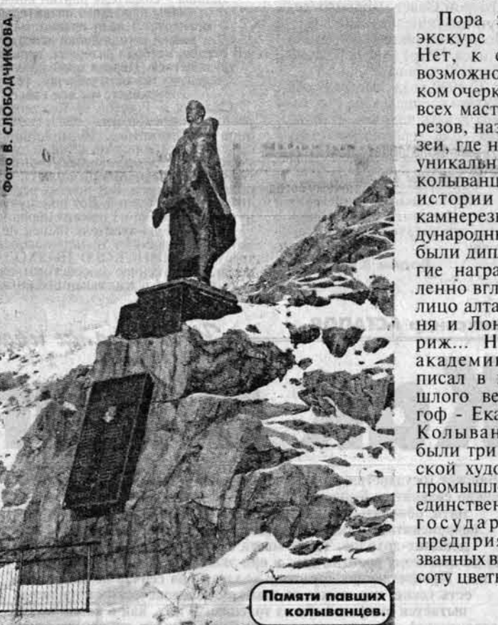
Памяти павших колыванцев.

Пора заканчивать экскурсию в историю. Нет, к сожалению, возможности в кратком очерке вспомнить всех мастеров-камнерезов, назвать все музеи, где нашли приют уникальные творения колыванцев... Были в истории Колывани камнерезной и международные выставки, были дипломы и другие награды... Изумленно вглядывались в лицо алтайского камня и Лондон, и Париж... Не случайно академик Ферман писал в начале прошлого века: «Петергоф - Екатеринбург - Колывань. Таковы были три центра русской художественной промышленности, три единственных в мире государственных предприятий, призванных выявлять красоту светного камня».