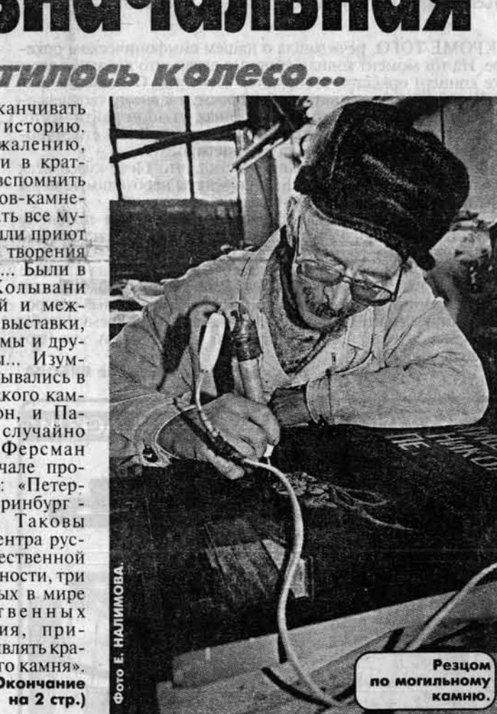
Резцом по могильному камню.