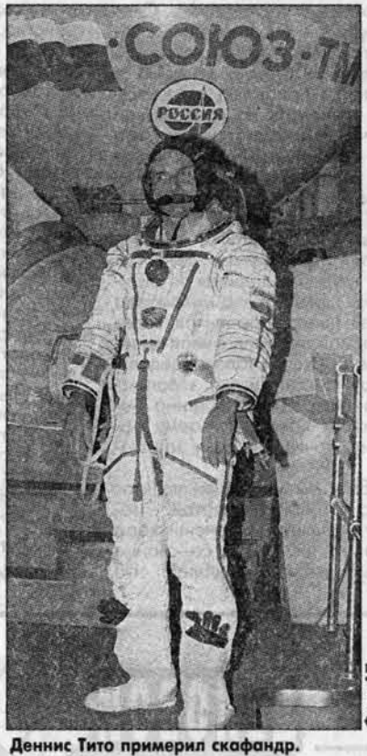
Деннис Тито примерил скафандр.