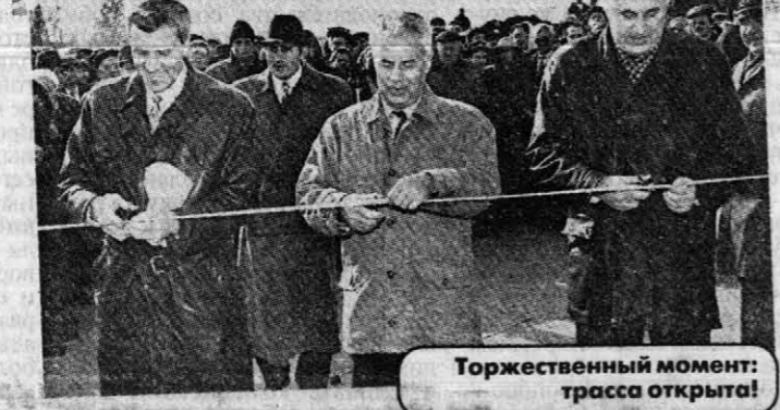
Торжественный момент: трасса открыта!

В прошедшую пятницу состоялось событие, которого дорожники и автомобилисты Алтайского края ждали два года. Возле села Луговское Тальменского района открылось рабочее движение по федеральной дороге Алтай - Кузбасс. 137 километров алтайского участка перво-классной дороги, реконструированной на основе заброшенного железнодорожного полотна, государственная комиссия приняла без особых претензий.