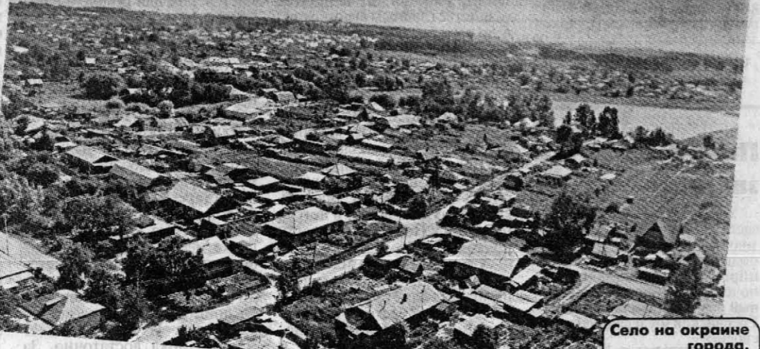
Село на окраине города. Вид с птичьего полета.