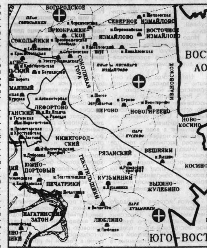
Места захоронения отравляющих химических веществ на территории города Москвы.

Согласно законам химии, сжиженный иприт при соприкосновении с внешней средой должен был со временем разложиться на составляющие. Однако ученые с изумлением констатировали, что кузьминский иприт не подвергся разложению.