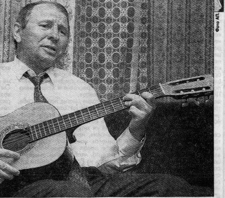
Сам Кучма, любящий побренчать на гитаре, попадает сегодня под запрет борцов за чистоту украинской мовы.

Причины две. Во-первых, антироссийская политика есть суть всего внешнеполитического курса г-на Кучмы.