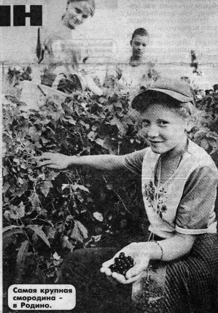
Самая крупная смородина - в Родино.