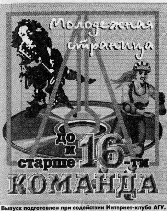
Выпуск подготовлен при содействии Интернет-клуба АГУ.