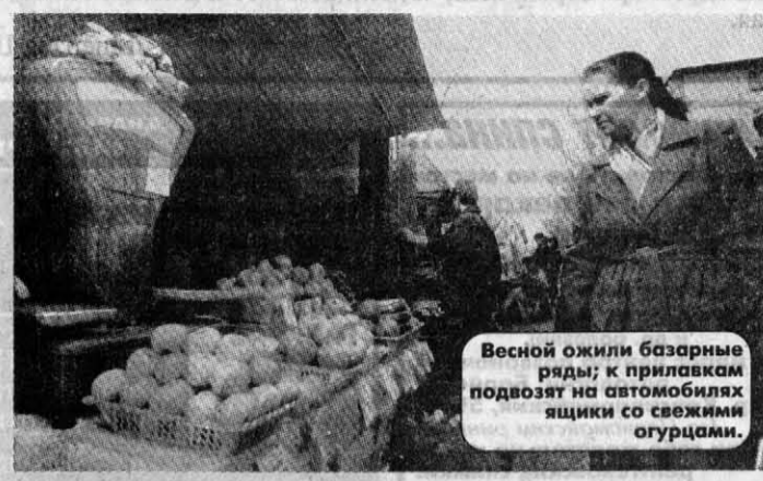
Весной ожили базарные ряды: к прилавкам подвозят не только овощи, но и свежие огурцы.