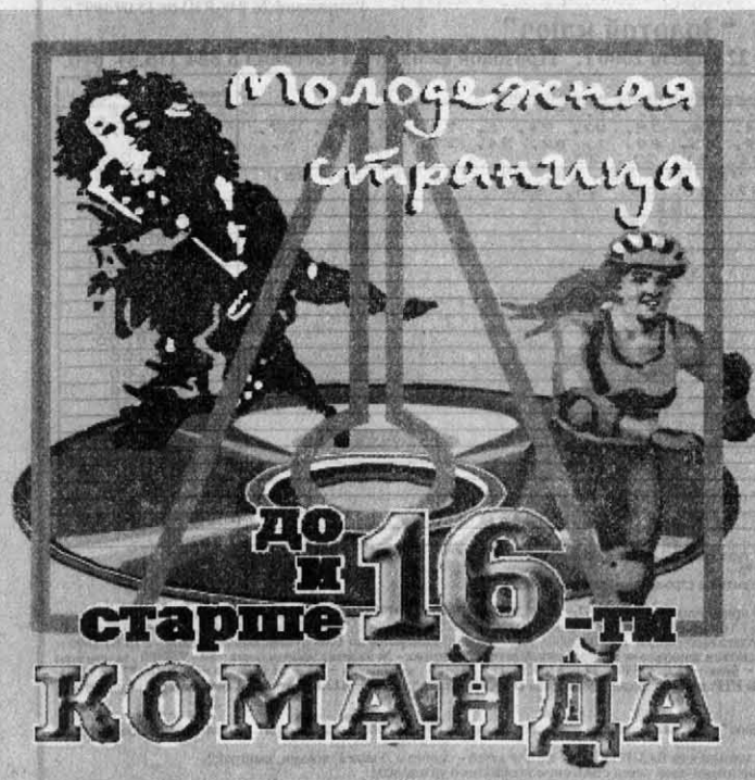
Выпуск подготовлен при содействии Интернет-клуба АГУ